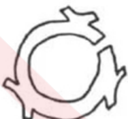
距今约 3000 年 浙江衢州西山村遗址出土