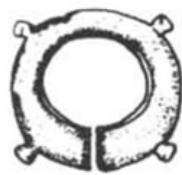
距今 3500—2000 年 台湾台东卑南遗址出土