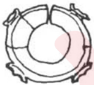
距今 5000—4000 年 广东曲江石峡遗址出土