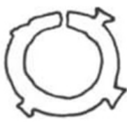
距今约 3000 年 香港南丫岛遗址出土