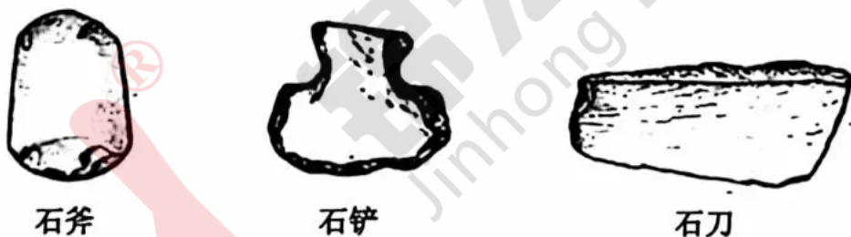
图 1 兴隆洼遗址出土的石器图像