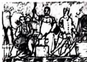
图3 供应城市需要，支援工业建设（1956）