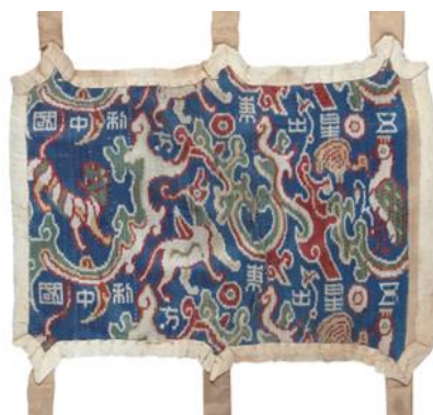
“五星出东方利中国”织锦护膊

材料一 位于新疆民丰县的尼雅遗址是汉代精绝国遗址，它地处中西文化交流的关键区域。1995 年，考古学家在该遗址发现一块织锦护膊，上面有“五星出东方利中国”八个汉隶文。“五星出东方利中国”是一句具有政治寓意的占辞术语，《史记·天官书》曰：“五星分天之中，积于东方，中国利。”以五星所聚方位来判断行师用兵的利弊关系。“五星”锦的织造工艺，明显是出自汉代皇家织造，用最高规格的华丽织锦为面料，采用汉代蜀锦独有的经线提花的织造方法。“五星”锦上的动物则多为远方贡纳或神化的珍禽异兽，多了些异国情调的艺术主题。