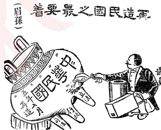
图1 马星驰《再造民国之最要者》