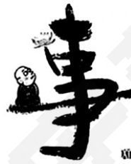
凡事磨你,皆为渡你