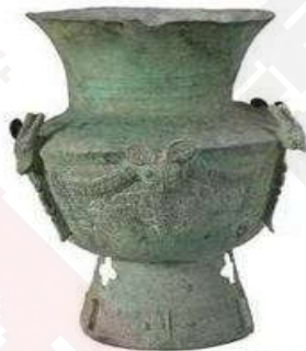
三星堆出土的铜尊

1. 三星堆遗址是一处距今约 4500 年至 2800 年的古蜀文化遗址,该遗址出土的一些文物风格与黄河流域夏、商的文物风格具有相似性。如图分别是三星堆出土的铜尊和商朝的青铜尊,据此可以推断