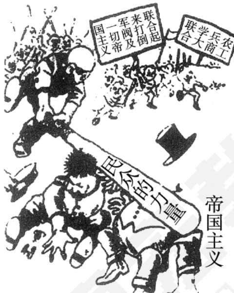
行印部治政军一第军命革民国党民国国中

10. 下图是 1926 年中国国民党国民革命军第一军政治部印制的招贴画《民众的力量》，对该画理解正确的是