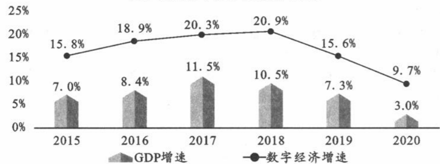
图2 我国数字经济增速与GDP增速